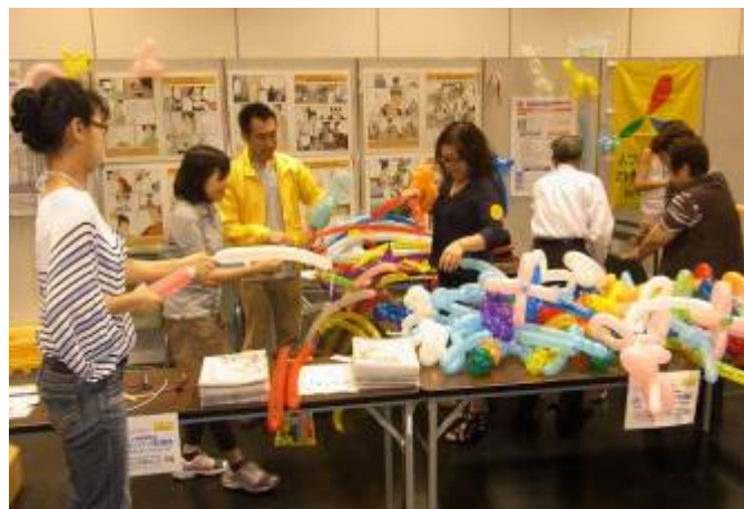
オープニングを前に、準備に大忙しのスタッフ