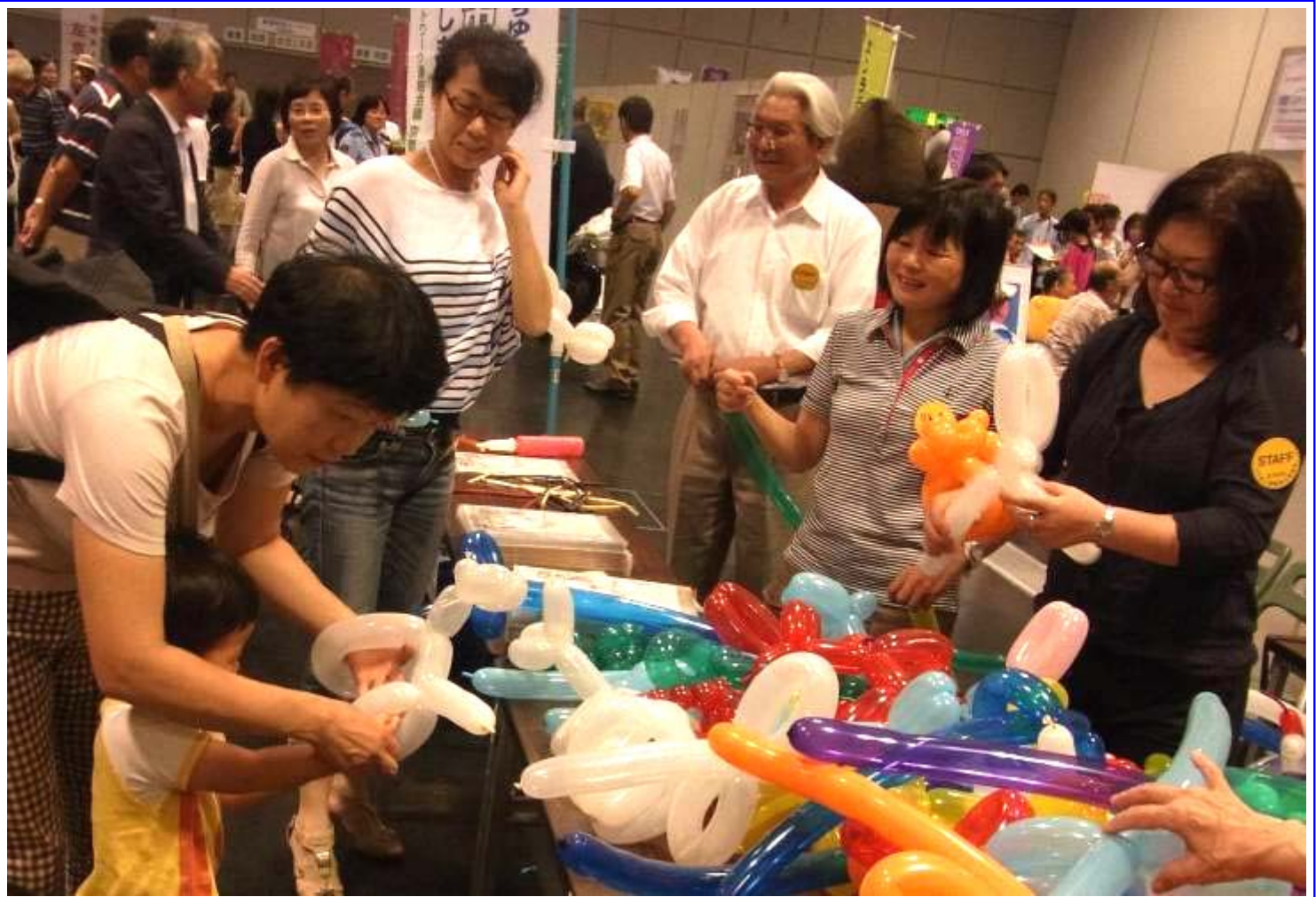
ペンシルバルーンを手にする幼児のしぐさに、思わず笑みを浮かべる「人づくり」ネットワーク実行委員のスタッフ