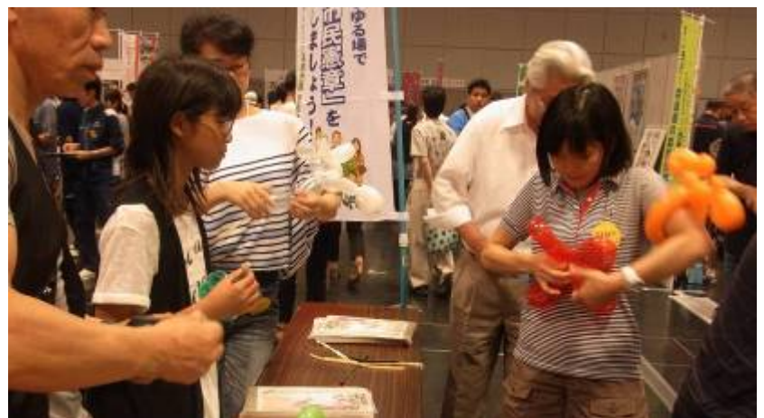
「人づくり」のスタッフが操るペンシルバルーンアートに興味津々の参加者