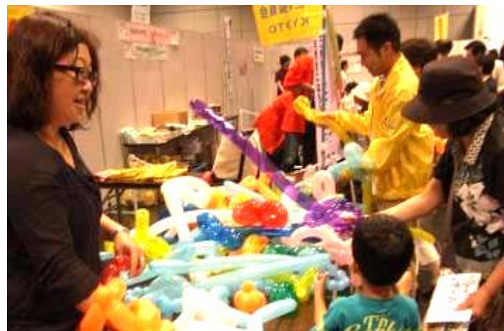
ペンシルバルーンの剣を手にする子ども