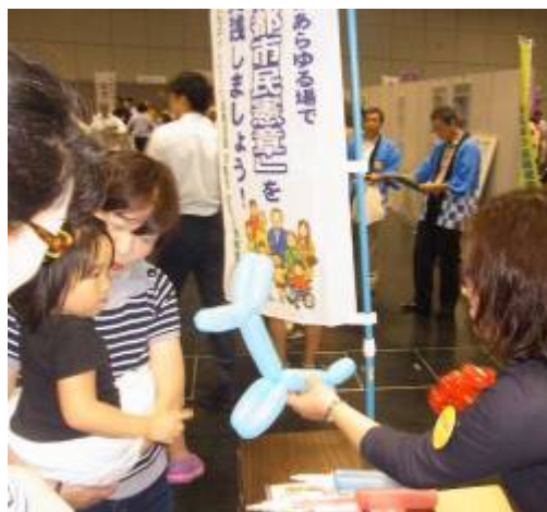
すずめられたウサちゃんバルーンにおそろおそろの子ども