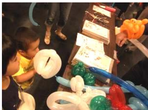
スタッフ手持ちのペンシルバルーンを見つめる幼児