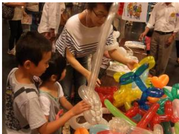
ペンシルバルーンの品定めをする子どもたち