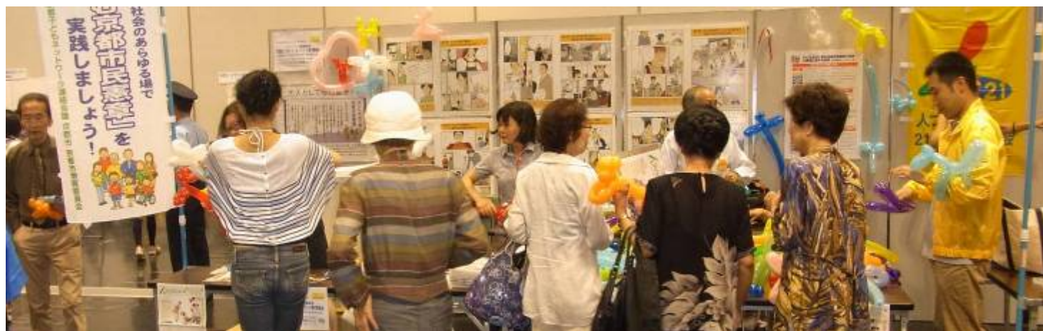
「子どもを共に育む京都市民憲章」の啓発展示の前で、ペンシルバルーンアートで人寄せをする実行委員のスタッフ