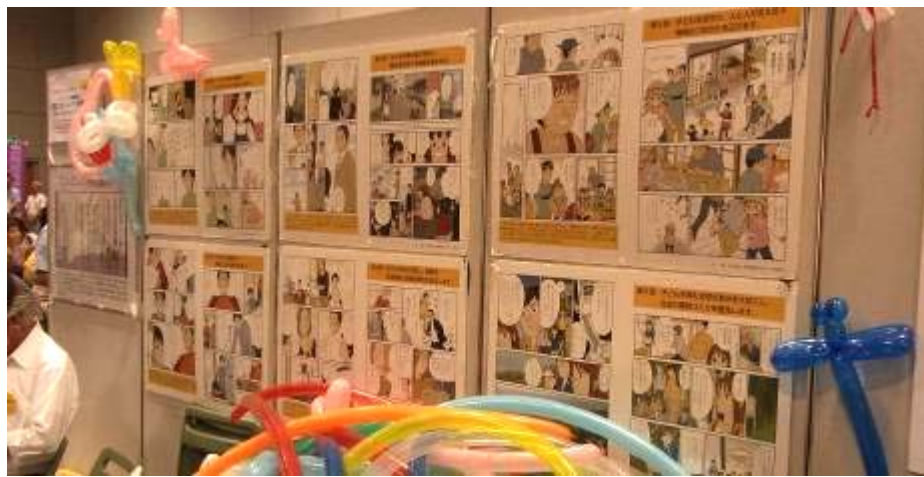
会場に掲示された「子どもと共に育む京都市民憲章」の漫画パネル