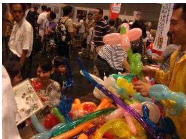
啓発パンフとともにバルーンを受け取る参加者