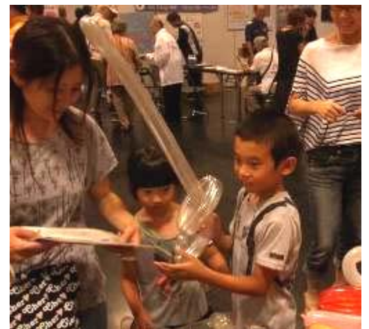
「人づくりニュース」に目を通す親子